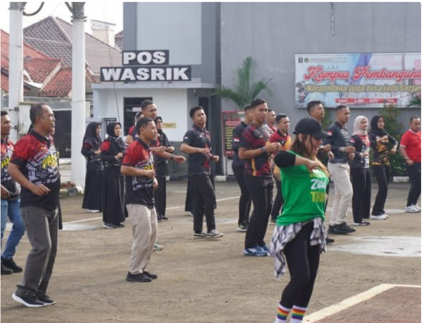
Jaga Kebugaran Tubuh, Pegawai Lapas Kelas IIA Purwokerto Senam Pagi Bersama

PURWOKERTO - Kegiatan senam pagi ini dilaksanakan di halaman gedung utama yang dimulai pukul 07.45 yang dipandu oleh instruktur profesional. Kegiatan ini diikuti oleh Kalapas dan seluruh pegawai Lapas Kelas IIA Purwokerto, pada Sabtu (25/1/2025).